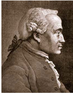
Immanuel Kant 1724 – 1804